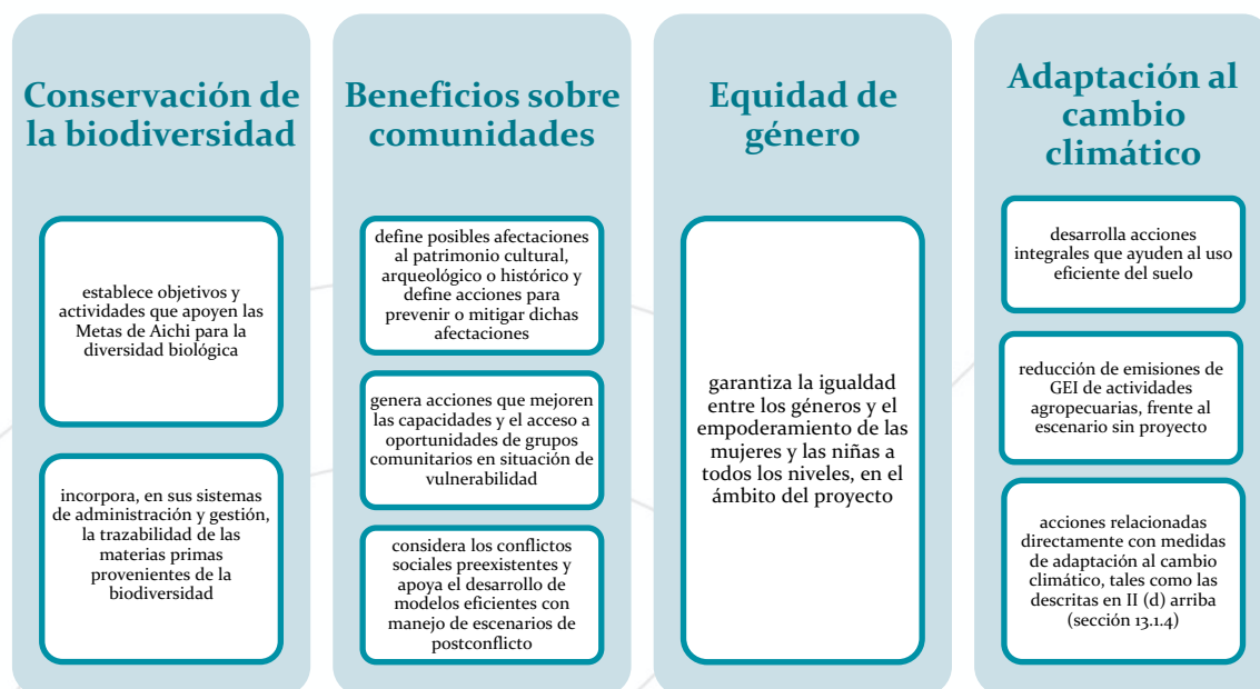
Ilustración 3. Requisitos de la categoría Cóndor andino

El Cóndor de los Andes ( Vultur gryphus ), el mensajero del sol, se considera el ave voladora más grande y pesada que existe en el mundo. 38 Es también una de las aves que vuela a mayores alturas, puede volar utilizando las corrientes térmicas ascendentes verticales de aire cálido y puede alcanzar hasta los 6500 metros de altitud; luego puede planear por cientos de kilómetros casi sin mover las alas extendidas. El cóndor andino se encuentra distribuido a lo largo de la Cordillera de los Andes, desde el sur de la Tierra del Fuego (Argentina y Chile) hasta el occidente de Venezuela. Uno de sus mayores hábitats se encuentra en el Cañón del Colca (Perú). El cóndor andino es considerado una especie casi amenazada por la UICN (Unión Internacional para la Conservación de la Naturaleza), las amenazas a la población incluyen pérdida de hábitat y envenenamiento secundario. 39 Los requisitos para obtener la Categoría Cóndor andino se presentan en la Ilustración 3.